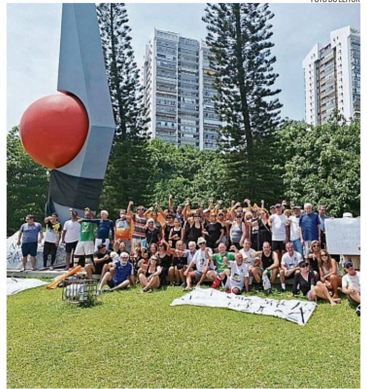
Protesto. Manifestantes reunidos na Praça Gilson Amado, diante do Riviera

A licitação teve um único interessado, a Green Limpeza e Coleta de Lixo Ltda, de coleta de resíduos não perigosos, que apresentou como proposta o valor mínimo, de R$ 33,5 milhões. Pelo regulamento, o Riviera dei Fiori tem direito à preferência no certame, e poderá manifestar interesse na compra do terreno em outra sessão pública, no dia 14, quando o arrematante se-