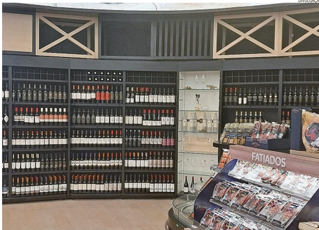
Loja conceito. Nova unidade do Supermarket terá adega, aulas de gastronomia, shows e área kids

poderão ser encontrados produtos pouco comuns em supermercados, frisa ela, como artigos da rede Boticário, de perfumaria fina; e chocolates da marca suíça Milka em sabores só vendidos fora do Brasil ou no free shop dos aeroportos.