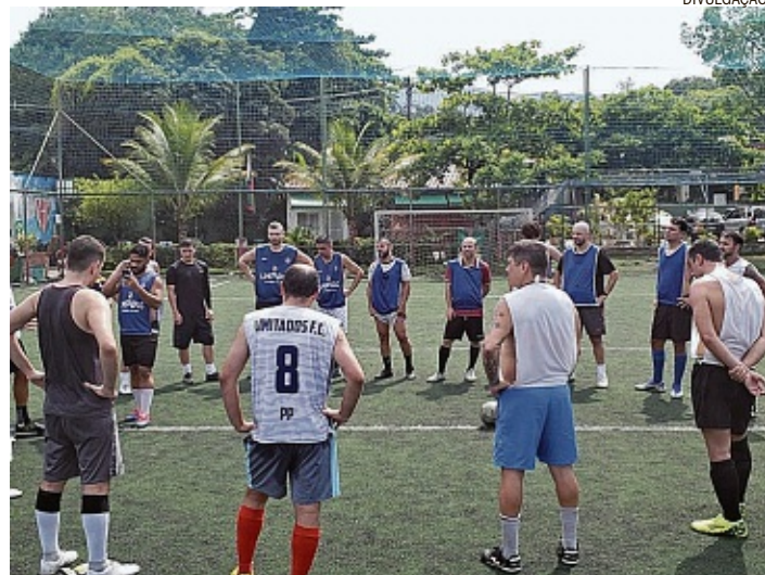
Limitados Futebol Clube. O grupo de pelada vai jogar em prol de doações

ba sem Fome, que também existe há mais de dez anos, e resolveu fazer o convite para a parceria: