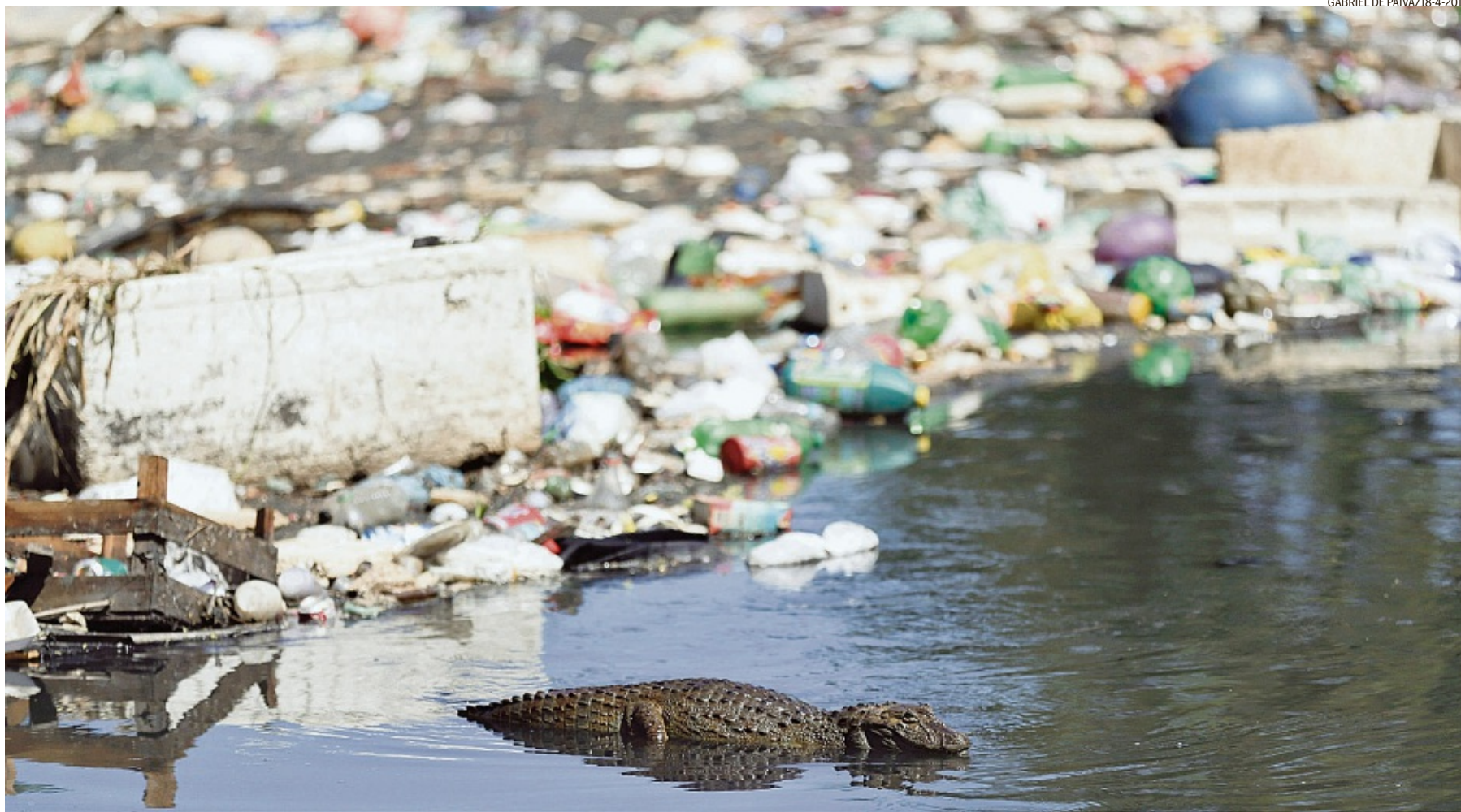
Poluição. Jacaré-de-papo-amarelo divide espaço com resíduos no Arroio Fundo: espécie é símbolo da campanha “Se liga, condomínio”, que pretende evitar o despejo irregular de rejeitos

O caminho para a despoluição do sistema lagunar passa pela redução do despejo irregular de rejeitos em rios, canais e lagoas. E é com a missão de contribuir com a solução desse desafio que o Comitê de Bacia da Região Hidrográfica da Baía de Guanabara e dos Sistemas Lagunares de Maricá e Jacarepaguá (CBH Baía de Guanabara), que tem como competência a gestão dos recursos hídricos do estado, lançou, no último dia 29, em parceria com a Câmara Comunitária da Barra da Tijuca (CCBT), a campanha “Se liga, condomínio”, cuja proposta é incentivar os residenciais a regularizarem a ligação de sua rede de esgoto.