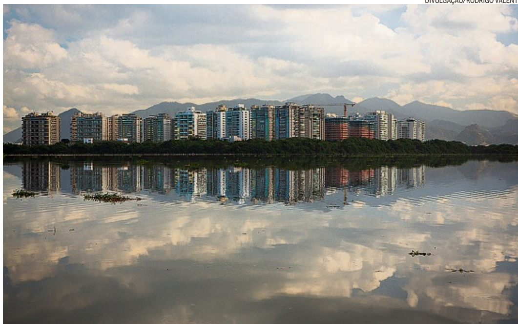
Zona dos Canais. Campanha quer proteção de todos os corpos hídricos da região e atuará em diferentes pontos